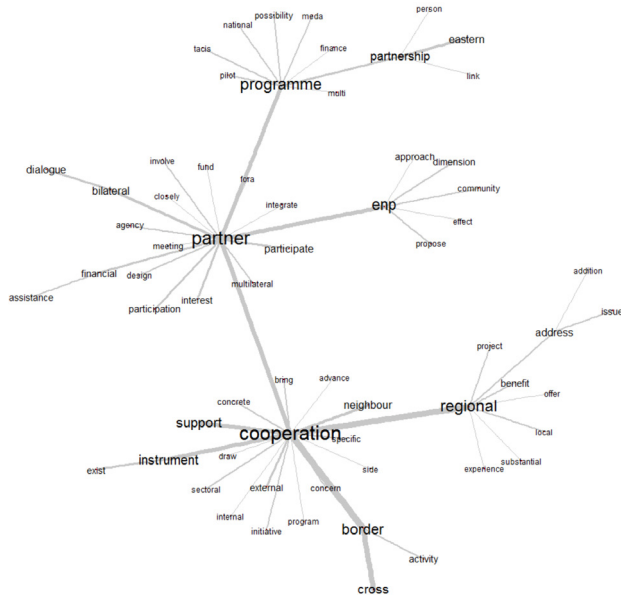
Figure 1. Univers lexical associés aux modalités de fonctionnement de la PEV

Le vocabulaire utilisé pour mettre en mots la politique de voisinage à intervalles de temps réguliers met en évidence des univers lexicaux qui se dessinent autour de notions-clés. L'analyse des communications-cadres de 2003 à 2013 révèle une grande diversité des mondes lexicaux en lien avec la désignation des entités spatiales. Plusieurs méthodes peuvent être utilisées pour étudier ces univers : fixer un objet spatial (région, nation) et interpréter son contexte d'utilisation, ou partir d'un des univers lexicaux qui émergent du corpus 3 et interpréter les proximités autour de notions qui paraissent pertinentes. Les graphes de similitude (figures 1 et 2) illustrent la configuration de deux mondes lexicaux associés, l'un autour des modalités de fonctionnement et d'action de la PEV (figure 1), l'autre autour des pays éligibles à la PEV (figure 2).